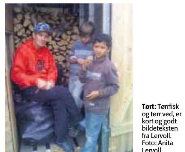
Tørt: Tørrfisk og tørr ved, er kort og godt bildeteksten fra Lervoll.