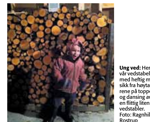
Ung ved: Her er vår vedstabel med heftig musikk fra høytalere på toppen og dansing av en flittig liten vedstabel.