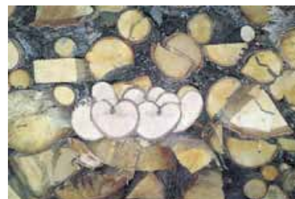
Hjertepynt: Vedstabelen til han Ingebrigt var ikke så veldig vakker i utgangspunktet, men med litt kjærlig hjelp fra kjerringa så ble den ikke så værst.