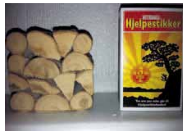
Miniatyr: Vedstabelen min.