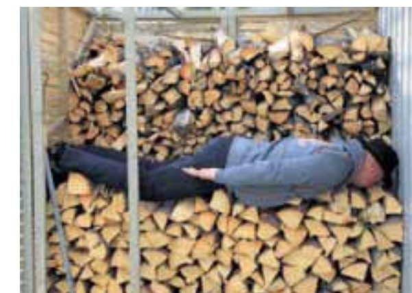
Planking: Vedstabel med planke, lyder den fyndige teksten fra Arne-Wilhelm Theodorsen som har sendt inn dette bildet.