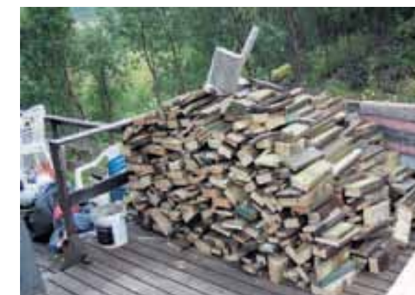
Plankeved: Vedstabel av verandaen på hytta.