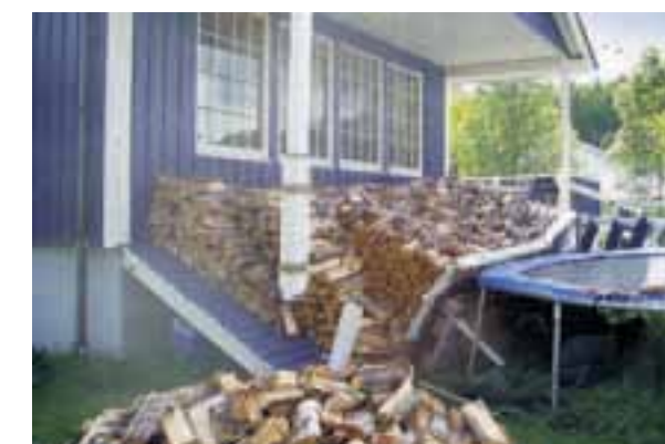
Ve(d)modig: Vedstabelen skulle få et trygt tilholdssted på verandaen. Men verandaen ga seg over og her er det triste resultatet.