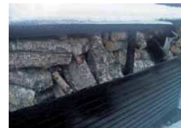
Analysen: Spent på hva analytikerne sier om denne stabelen, fra hytta vår i Målseiv Fjellandsby, God helg!