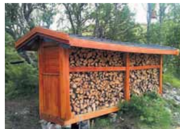
Sirlig: Godt og luftig i selvbygd vedlager.